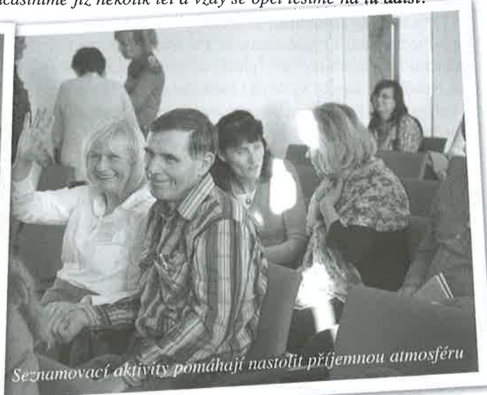
Seznamovací aktivity pomáhají nastolit příjemnou atmosféru

na kterých se setkávají účastníci ve dvojicích, aby spolu vedli rozhovory na nekontroverzní témata (např. oblíbené jídlo, kam jezdíte na dovolenou apod.). Jinou možností je sednout si v kruhu, představit se a hovořit o tom, co komu v poslední době udělalo radost. Teprve pak přichází na řadu úvodní slovo a doplňující informace o dalším průběhu setkání.