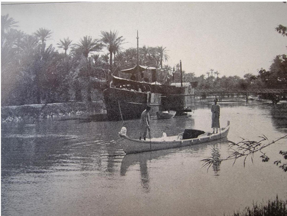
Na řece Eufkrat, konec 19. století

V roce 1909 také odchází definitivně z Olomouce. Odolá lákání Prahy a přesídlí do Vídně, která mu poskytne odpovídající zázemí pro jeho vědeckou práci. Přestavuje rodný dům v Rychtářově, ale v roce 1910 je opět v severozápadní Arábii. Podílí se na topografickém mapování území Hidžázké dráhy, projektu Osmanské říše. Na této expedici začíná hledání pravé lokality Mojžíšovy hory, kdy nepovažoval za možné, aby byla totožná s dosavadní náboženskou tradicí. Musil zřejmě nikdy pravou horu nenašel, alespoň neoznačil konkrétní vrchol, ale definitivně ji situoval do oblasti oázy al-Bad. Provádí četné topografické mapování oblastí Hidžázu a Nadždu (dnešní Saudská Arábie a Irák), pořizuje otisky starověkých napsů a reliéfů.