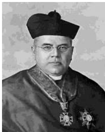
Obr. 3 arcibiskup Stojan