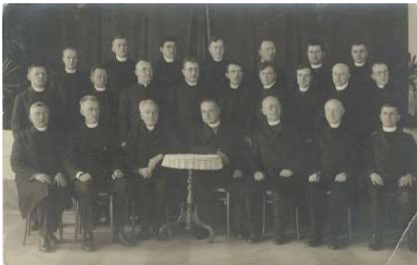
Obr. 7 profesori 1930