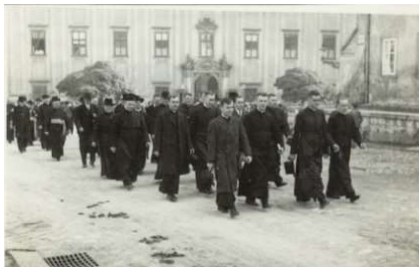
Obr. 8 sbor