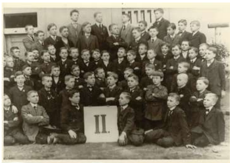
Obr. 9 sekunda

Prefekti a profesori gymnázia po celou historii školy také usilovně budovali knihovny a sbírky, které sloužily jako didaktické pomůcky k výuce. Finanční zdroje pocházely jednak přímo z peněz semináře a později gymnázia, ale především z darů, ať již peněžních nebo přímo fyzických předmětů do sbírek. Knihovna také rostla z nejrůznějších odkazů a pozůstalostí. Sbírkami se budovaly cíleně a plánovitě, za každou část byla zodpovědná určitá osoba ze sboru. I po léta, kdy škola trpěla hmotnou nouzí, sbírky obohacovaly dary a drobné odkazy a také knihovna narostla do impozantních rozměrů. Nedochovaly se bohužel inventáře sbírek, a tak o jednotlivostech a jejich nakupech víme pouze z nepřímých zmínek a poznámek učitelů.